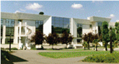
LYCEE LIVET (NANTES)