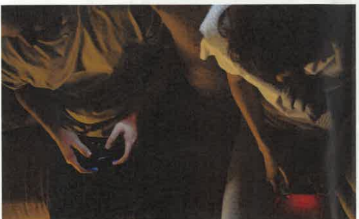
Des jeux vidéo plus responsables à l'avenir ? Photo d'illustration libre de droits.