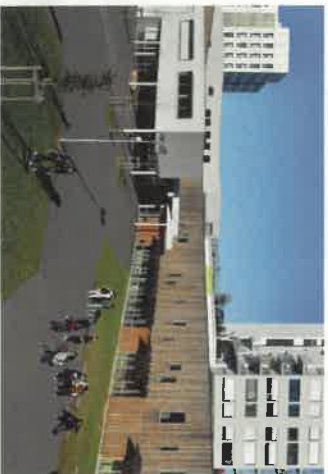
Le collège Sophie Germain.