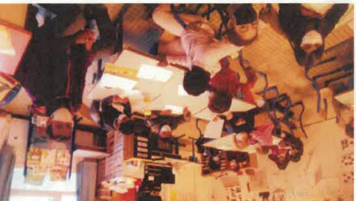
Les élèves de l'école Ange Guépin et leur professeur en train de dessiner 'l'école du futur'.

Pédagogie Freinet : « Les enfants peuvent être plus autonomes » Reno Geng Orliol est enseignant depuis 12 ans à l'école Ange Guépin à Nantes. Une école qui pratique les « nouvelles » méthodes pédagogiques.