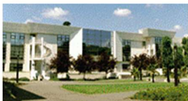
LYCEE LIVET (NANTES)